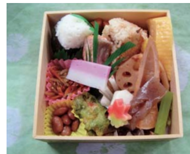
おむすび弁当 暫く