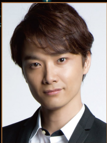
井上芳雄 YOSHIO INOUE